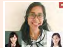
※生徒の画像はイメージです。

TRYANGLE最大の特徴は、テキストと講師が一画面で表示されることです。他のオンライン英会話でよくある、「講師が指示を出している場所がわからない」「お互いが見ているところが違う」などのトラブルが100%起こりませんので、時間内でしっかりとしたレッスンを受講できます。