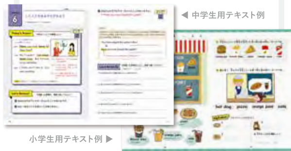
◀ 中学生用テキスト例

学習指導要領に沿った内容、つまり生徒が「今、学校で学ぶべき単元」で作成された教材になっているので、定期テストはもちろん、先々の受験対策をいち早く行えます。テキストは、小学生・中学生の教材を長年編集している、学習教材のプロフェッショナルが監修しています。